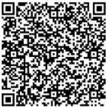
申込フォーム (QRコード)

https://s-kantan.jp/pref-shimane-u/offer/offerList_detail.action?tempSeq=12095