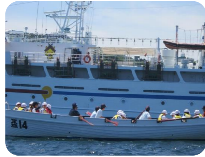
神海丸の近くまで漕ぎました