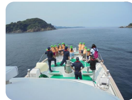
船首部から景色を見る園児