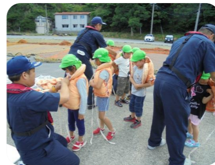
ライフジャケットを着る園児

6月22日(水)あおい保育園の年長クラスの園児さん13名と保育園職員3名が、海への関心と理解を深めるため、本校の小型実習船「あわしま」に乗船し、1時間程度の体験航海を行いました。園児たちは、普段見れない景色に興奮気味でした。