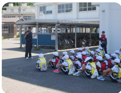
説明を聞く児童たち

6月13日(火)「H29 NAGAHAMA マリン郷育」と題し、長浜小学校6年生48名が海洋技術科3年生とカッター漕艇を行いました。小学生48名を3班に分け浜田港内を漕艇しました。