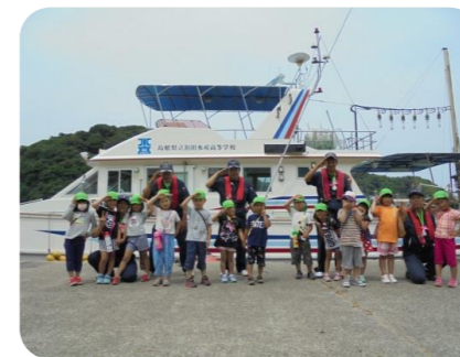
最後は、みんなで記念撮影