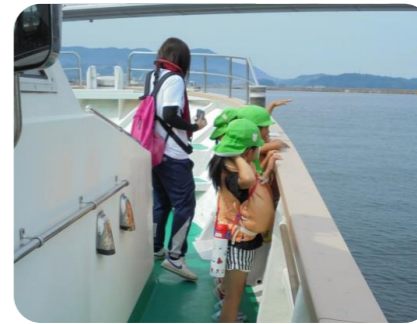
まもなくマリン大橋通過