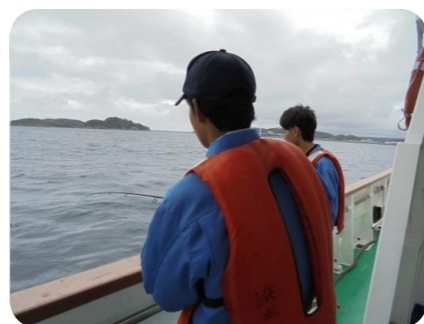
船釣りをする生徒