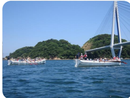
2艇並走するカッター