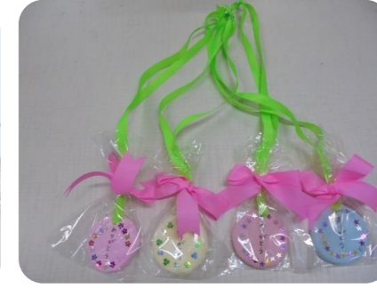
園児から素敵なメダルをいただきました