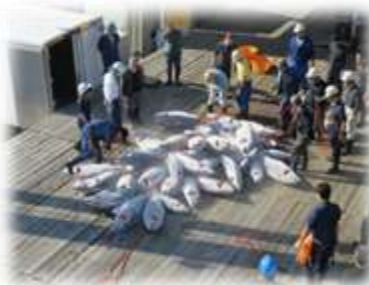
陸揚げされたマグロ