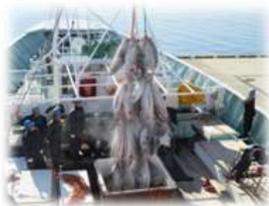
マグロ水揚げ作業を見学しました