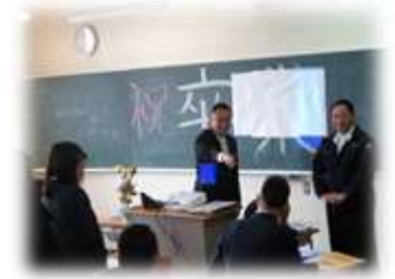
K3高校生活最後のホームルーム