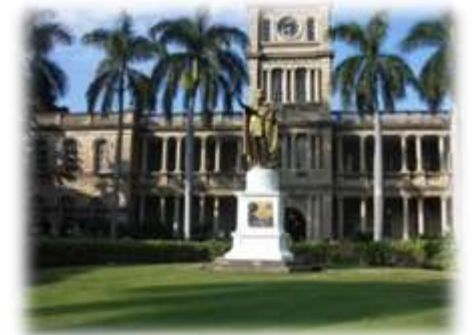
ハワイのカメハメハ大王像