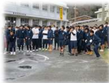
スタートを待つ男子生徒達

1月12日(木)浜田水産高校恒例の寒中ロードレース大会が開催され、男子は5.5km、女子は4.5kmを走りました。レース終了後は、保護者の皆さんが作った暖かい豚汁を頂きました。