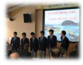
漁業班の SUIKO PROJECT2016