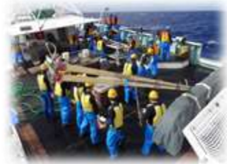
マグロ操業の様子

海洋技術科2年生と専攻科1年生が、約70日間に及ぶマグロ航海実習を終えて、神奈川県三崎港に入港し、下船式を行いました。