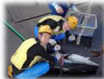
マグロの血抜き作業をするK2生徒