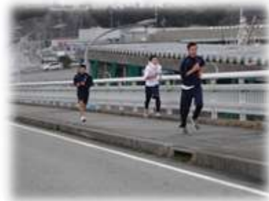
マリン大橋のキツイ上り坂を走る生徒達