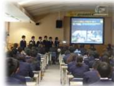
ものづくり班の発表

1月31日(火)いわみーるで本校が日頃課題研究等で取り組んでいる事を、K3生徒達がプレゼンし関係機関や地域の方々の前で発表しました。