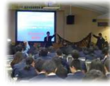
ワカメ養殖の発表