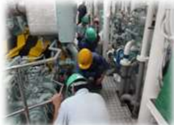
神海丸エンジン作業