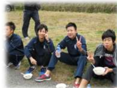
レース後の豚汁会