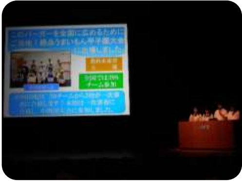
浜田水産高校の発表