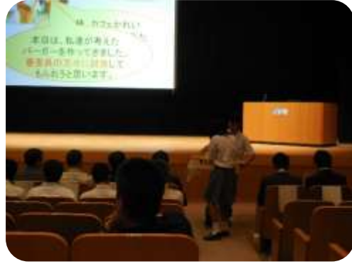
来賓の方にバーガーを渡す生徒