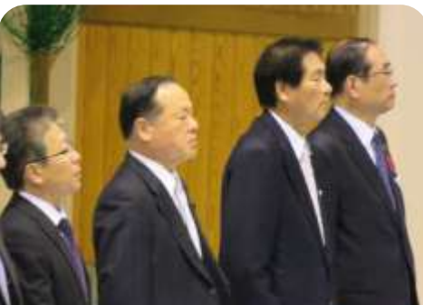
浜田市長をはじめ多くの来賓が来校されました。

また28日の記念式典では、浜田市長をはじめ多くの来賓の方が来校され、丸川先生の経歴や学校の沿革が紹介されました。