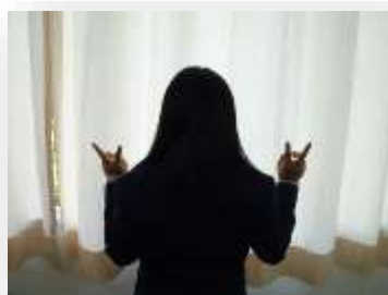
「恥ずかしがり屋さん」