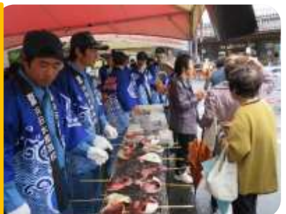
イカ焼き販売に専念するカッター部