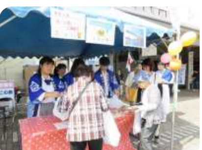
買い求めるお客様