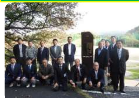
モニュメントサインを囲んで記念撮影