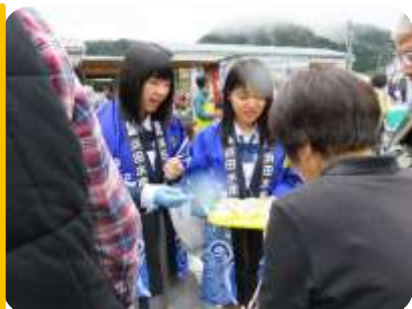
来場者に試食を勧める浜水クラブ

浜水クラブは実習製品、カッター部はイカ焼きを販売しました。準備前から雨が降っていましたが、次第に天候も回復し、会場では多くのお客様が製品を買い求めていました。お買い上げいただいた皆様、ありがとうございました。