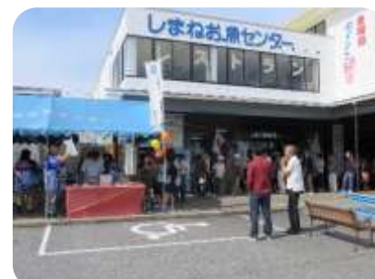
販売開始前から長蛇の列