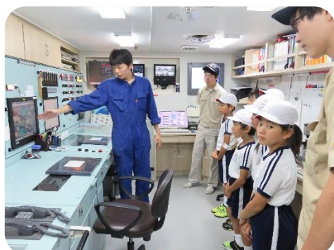
機関制御室を見学する児童たち(神海丸)