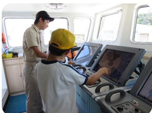
航海計器の説明を聞く児童たち(神海丸)

「Nagahama プリン郷育」の一環で、浜田商港長浜2号岸壁に接岸している島根県の大型水産練習船「神海丸」の船内見学を専攻科生の案内で行いました。船内見学をした児童は「楽しかった」「冷凍室はとても寒かった」とコメント。その後、児童たちは、本校の小型実習船「あわしま」に乗船し、浜田港内を回る体験航海をしました。体験航海をした児童からは「スピードが速くて気持ち良かった」などの感想がありました。