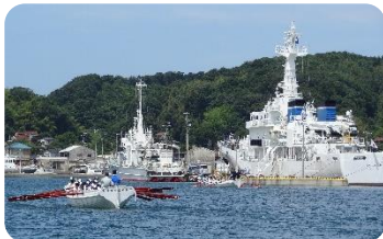
長浜岸壁まで漕艇(7/13)