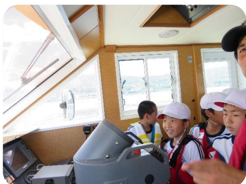
操舵体験をする児童(あわしま)