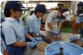
食品流通科実習体験をするK科の生徒(7/12)