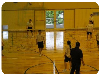
教員チームと対戦する優勝チーム(女子)