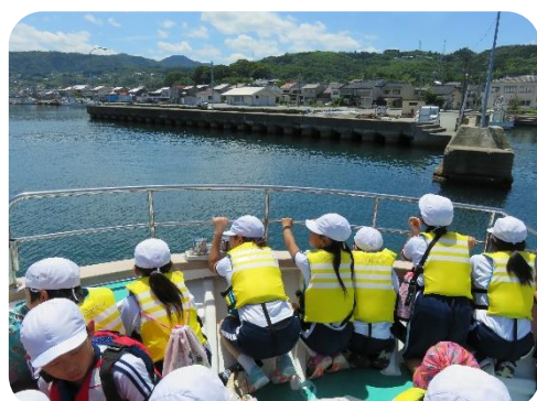
船首部から景色を見る児童たち(あわしま)