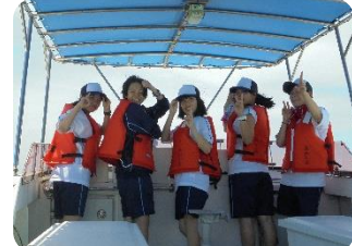
あわしまでの体験航海を楽しむS科の生徒(7/12)