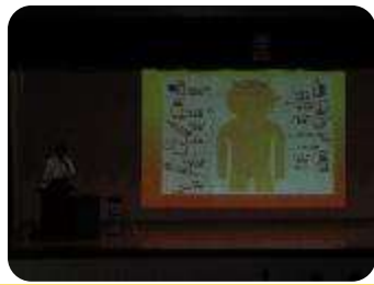
保健部の講演 『薬物乱用防止教育』