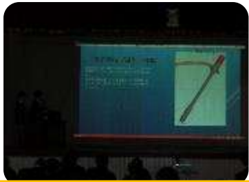
水中ロボットコンテスト発表