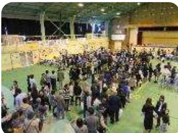
多くのお客様で賑わう 体育館