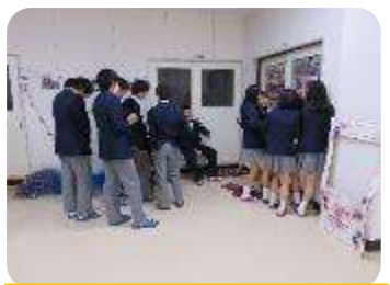
お化け屋敷で順番を待つ 生徒たち