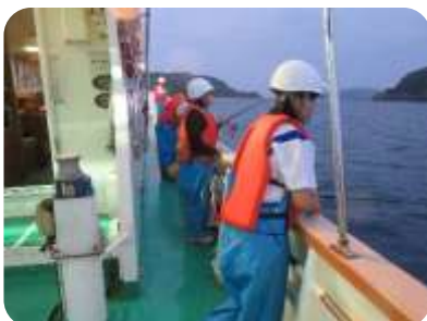
あわしまでの釣り実習体験