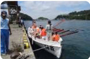
休憩のため岸壁に接岸(7/11)