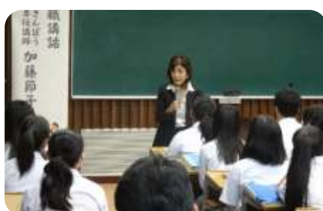
講師によるお辞儀の指導