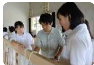
ロープワーク体験(7/8)

8日は天候不良のため雨科、ロープワークを行いました。 9日は、浜田消防署の方を講師に迎え、救命救急法を学びました。 10日・11日の両日は、浜田港内を漕艇しました。気温が高く、ムシムシとした天気で、休憩を取りながら行いました。 最終日の12日は、長浜岸壁までの漕艇は港外の海の状況が悪かったため浜田漁港内での漕艇訓練となりました。海洋技術科の2艇で競漕をしました。