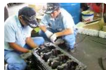
ヤンマー船用システム