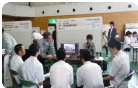
地元企業による説明