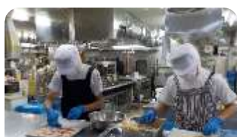
浜田ワシントンホテルプラザ

山本蒲鉾店・ダップス・クボタ牛乳・マルハマ食品・江木蒲鉾店・吉田屋・シーライフ・西川病院・あおい保育園・浜田ワシントンホテルプラザ