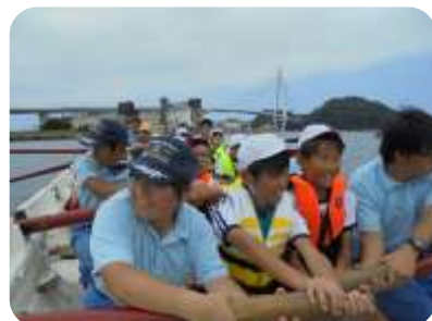
3年生と一緒に漕ぐ長浜小の児童たち

最後に同科3年生のカッター部によるデモンストレーションが行われ、これを見た児童たちは「速い！！」と言っていました。