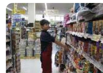
ジュンテンドー浜田店