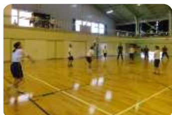
教員チームと対戦する優勝チーム（女子）