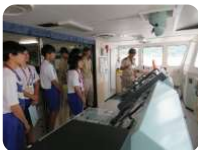
神海丸（船橋）を見学する生徒たち

体験実習をした生徒からは「今回の体験を進路選択の参考にしたい」「アジがたくさん釣れた」などの感想がありました。