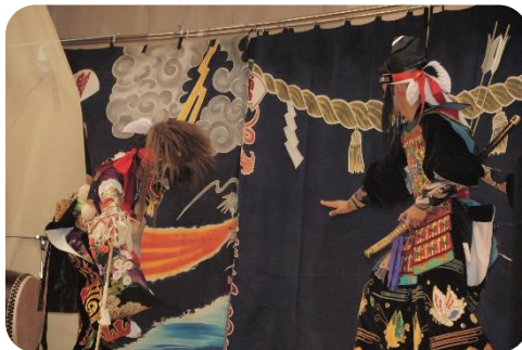
生徒有志による石見神楽