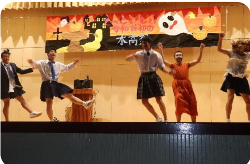
【生徒有志出し物】 ダンス