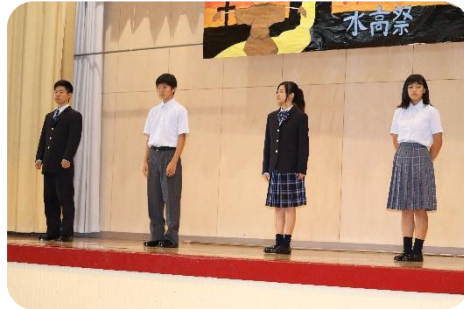
新制服のお披露目