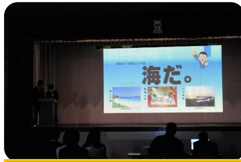
政策甲子園で発表した「水中ロボットを使った浜田市の観光を考える」