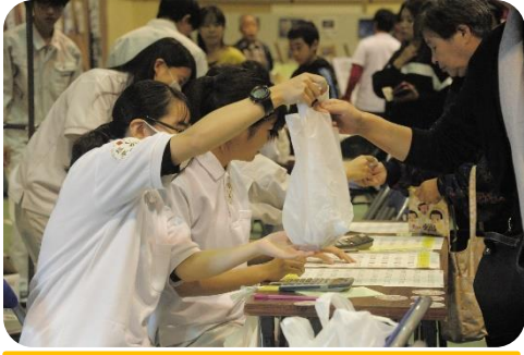
実習製品販売 (S科・体育館)