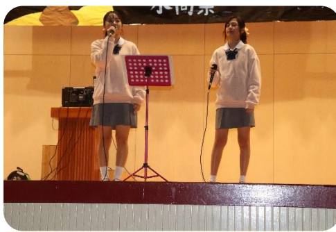
【生徒有志出し物】 歌