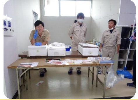
マグロ販売 (専攻科)