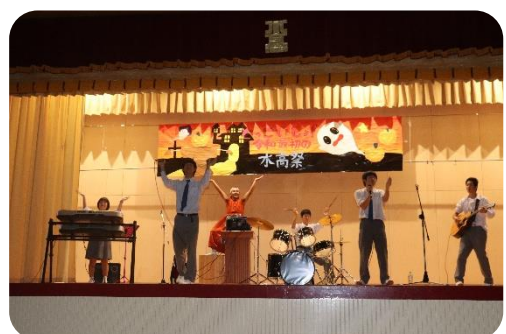
【生徒有志出し物】 バンドステージ