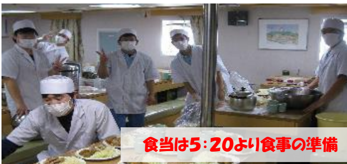
食当は5:20より食事の準備