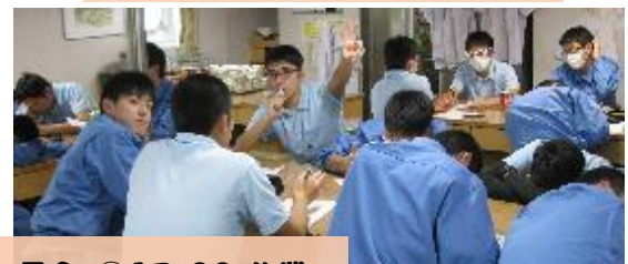
②6:50 朝食 ③8:00 掃除 ④8:30 学習 ⑤12:00 昼食 ⑥13:00 作業