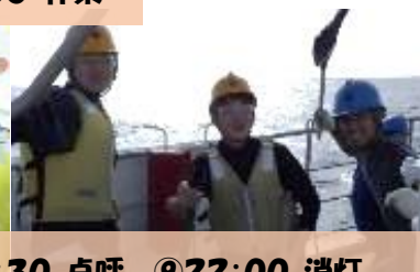
⑦17:30 夕食 ⑧20:30 点呼 ⑨22:00 消灯