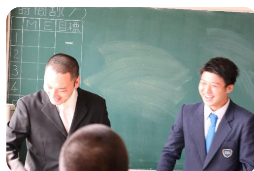
海洋技術科最後のホームルームの一場面