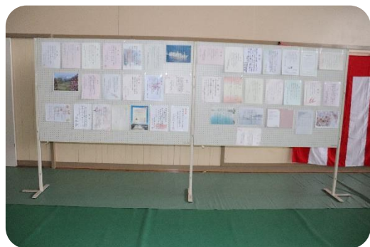
たくさんの祝詞をいただきました。ありがとうございました。