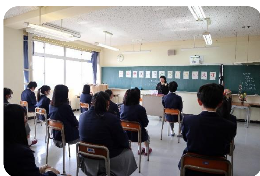
食品流通科最後のホームルームの一場面