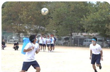
ボール入れレース