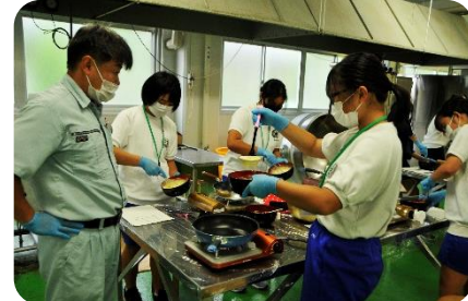
オリジナルパンケーキ作り