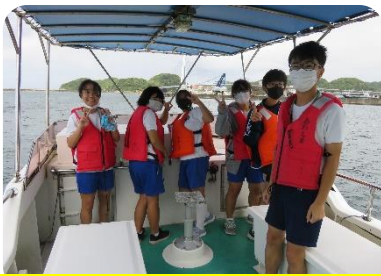
練習船「あわしま」体験乗船