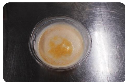
試食したアイスクリーム