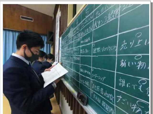
就職ガイダンス 会社作りゲーム

就職ガイダンスに来られた講師の先生が、「進学・就職に関係なく、早めに進路を設定し準備をする必要がある。そうしなければ進学・就職試験において、十分準備をしてきた人と競えない。」と言われていたのが印象に残りました。本当にその通りだと思います。皆さんできるだけ早くスタートしましょう。