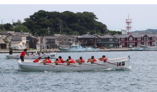
隠岐水産と浜田水産B（手前）のレース

7月23日（金）～25日（日）に浜田市で開催予定であった全国水産・海洋高等学校カッターレース大会でしたが、「依然として全国的に新型コロナウイルス感染症が収束しない状況を鑑み、全国から集まる大会を中止とし、各地においての記録会に変更する」との全国水産高等学校長協会の決定がなされました。これを受け、25日（日）に浜田漁港6号市場周辺海域を会場に、本校と隠岐水産高等学校カッター部が参加しての記録会が行われました。記録会では、3レースが行われ、各チームのベストタイムを全国水産高等学校長協会に報告しました。