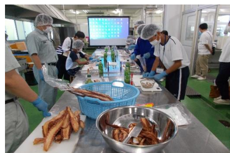
タコの燻製づくり