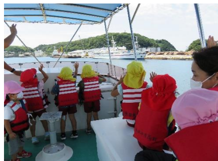
体験航海を楽しむ園児たち