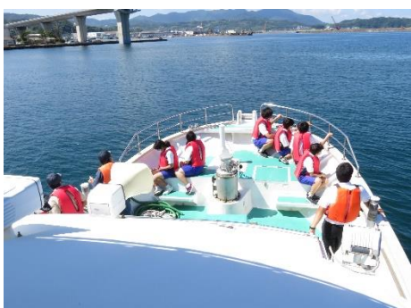
練習船「あわしま」体験乗船