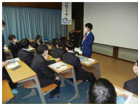
船員セミナーの様子