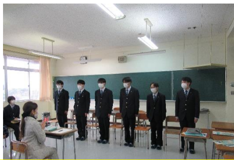
模擬面接体験の様子