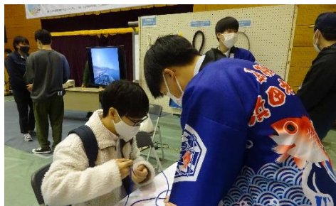
海洋技術科のブース

また、食品流通科のブースでは、缶詰手動巻締めの体験や、缶詰防災実験・試食などが行われました。多くの方が本校のブースに立ち寄っていました。