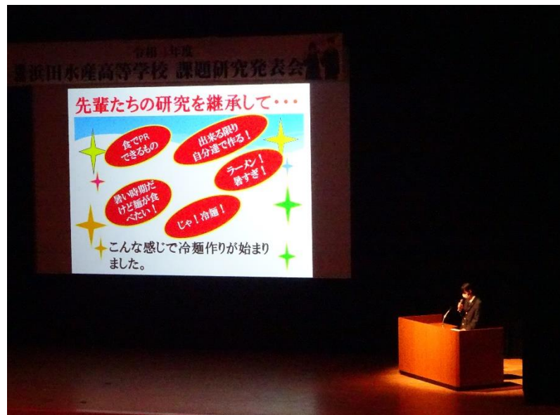
食品流通科（浜田冷麺班）の発表