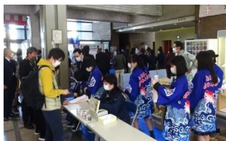
接客対応する食品流通科2年の生徒たち