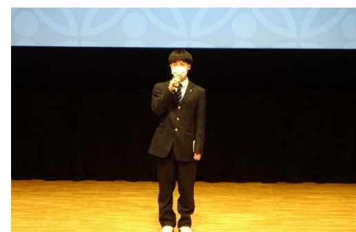
生徒会長あいさつ