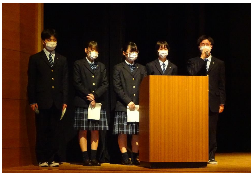
司会進行を担当する生徒会のみなさん

各班とも今までに学んだ専門知識・技能を活かした研究内容になりました。また、後輩の皆さんに後を任された研究もありました。 今年度もコロナウイルス感染症のため思い通りにいかないことも多々あったと思いますが、生徒達は熱心に発表していました。