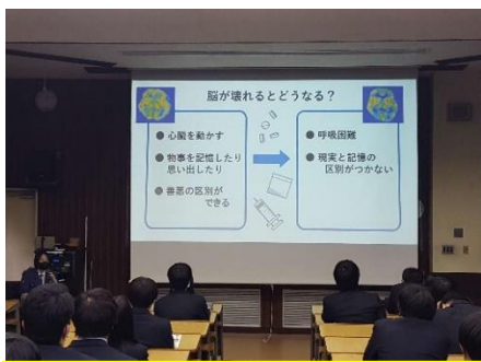
薬物乱用防止教室の様子