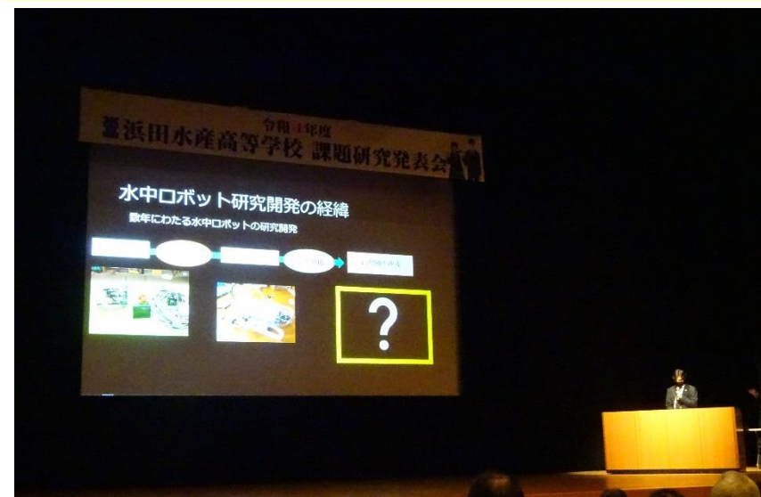
海洋技術科（ものづくり班）の発表