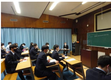
講師さんの話を聞く生徒たち

3年生に進級し、今後の進路を決めなければなりません。今回のガイダンスは進路選択をするにあたり参考になったのではないかと思います。