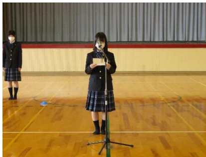
新入生代表あいさつ