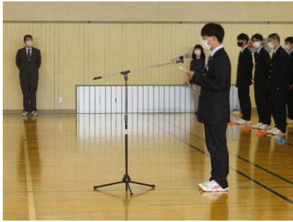
生徒会長あいさつ