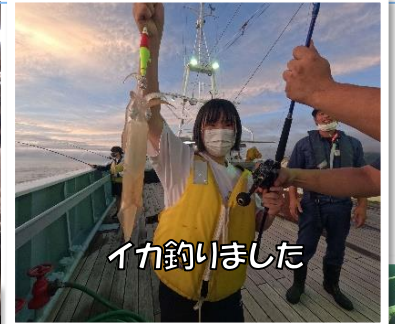
イカ釣りしました