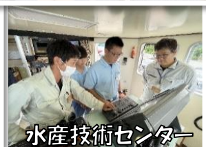
水産技術センター