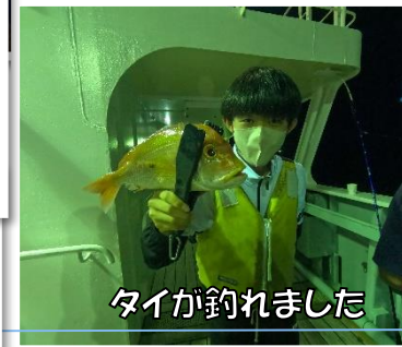
タイが釣れました