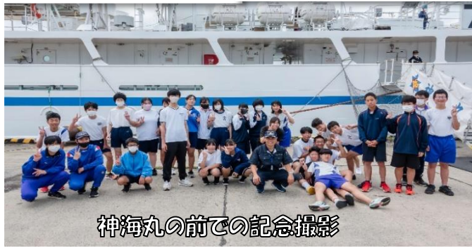
神海丸の前での記念撮影