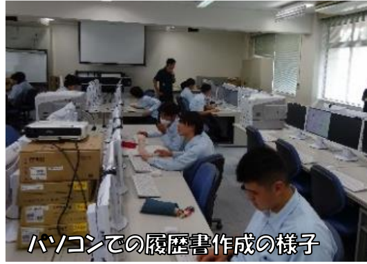
パソコンでの履歴書作成の様子