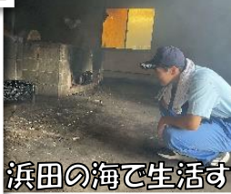
浜田の海で生活する会