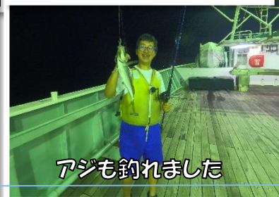
アジも釣れました