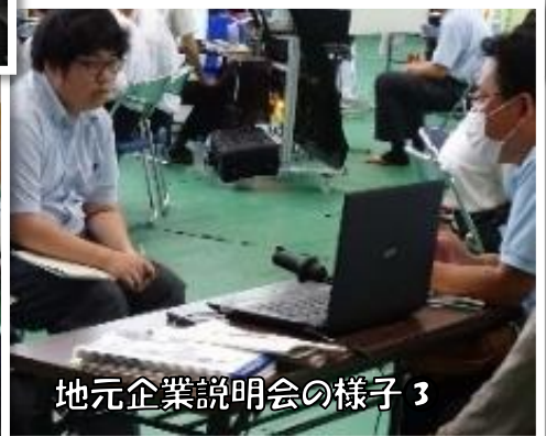
地元企業説明会の様子3