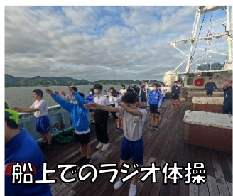
船上でのラジオ体操