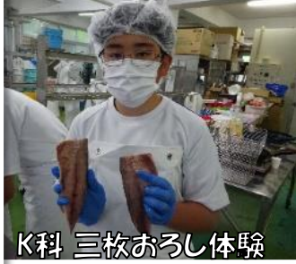
K科 三枚おろし体験