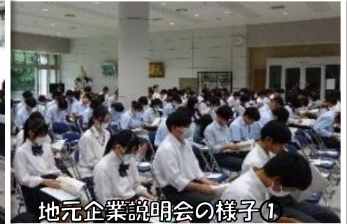
地元企業説明会の様子1