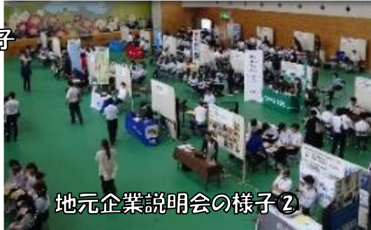
地元企業説明会の様子2