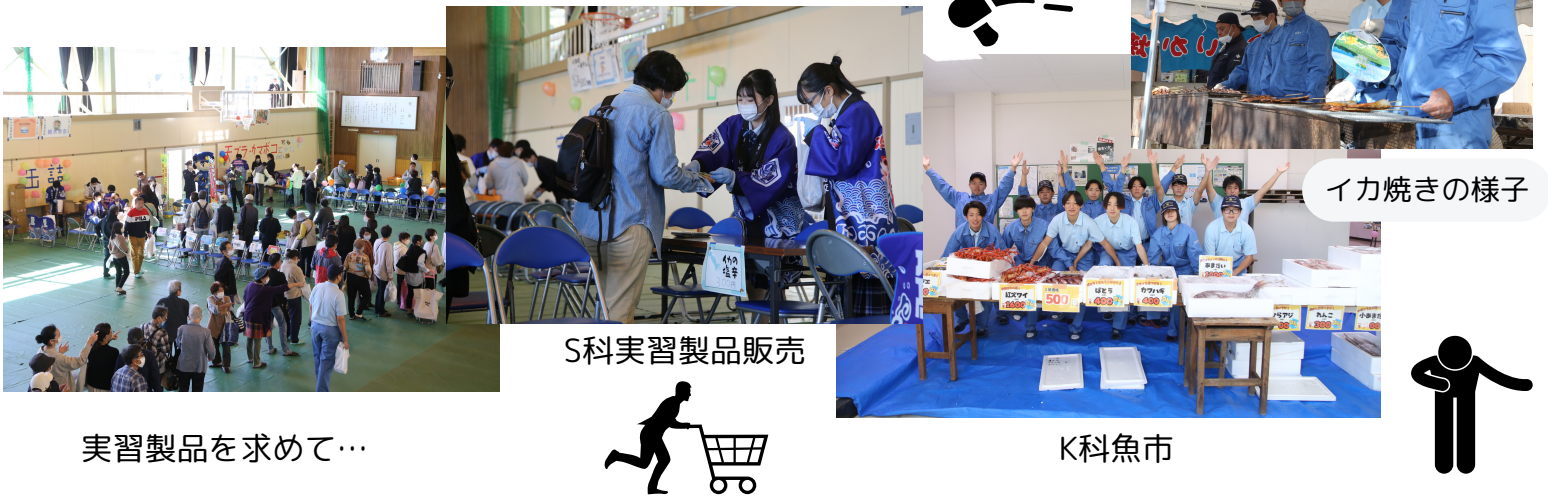
実習製品を求めて…