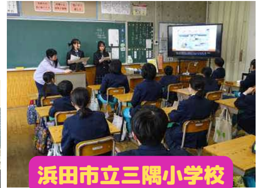
浜田市立三隅小学校