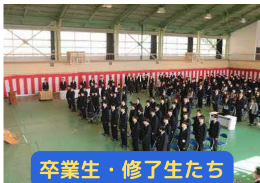
卒業生・修了生たち