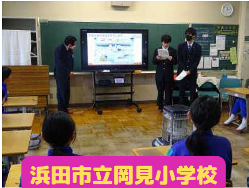
浜田市立岡見小学校

2月20日（火）浜田市立第二中学校3年生、22日（木）浜田市立岡見小学校6年生、27日（火）浜田市立三隅小学校6年生を対象に食品流通科1年生の2名がノドグロ給食に伴う出前授業を行いました。出前授業では、始めに浜田市水産振興課の方から「浜田市の漁業について」や「のどぐろが提供されるまで」の説明があり、その後、本校の生徒が「学校紹介」や「食品流通科で作っている実習製品」、「のどぐろ下処理から給食に提供されるまでの工程」について説明を行いました。