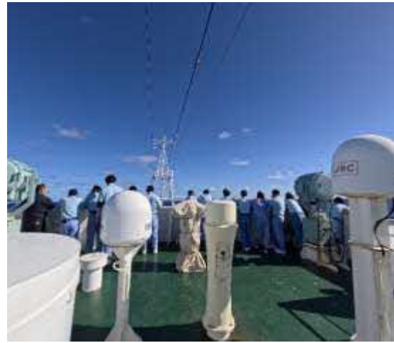
↑ 揚縄作業を見つめるたくさんのギャラリー ↑