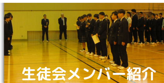
生徒会メンバー紹介